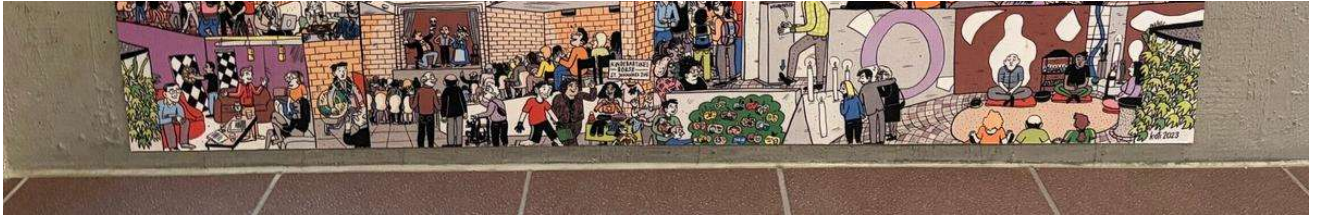
Das besagte Bild.

Tatsächlich scheinen das keine leeren Worte zu sein. Die Kirche unterstützt FRW finanziell und stellt Räume für Veranstaltungen zur Verfügung – auch wenn die meisten im Verein keine Katholiken sind und FRW kein christlicher Verein ist.