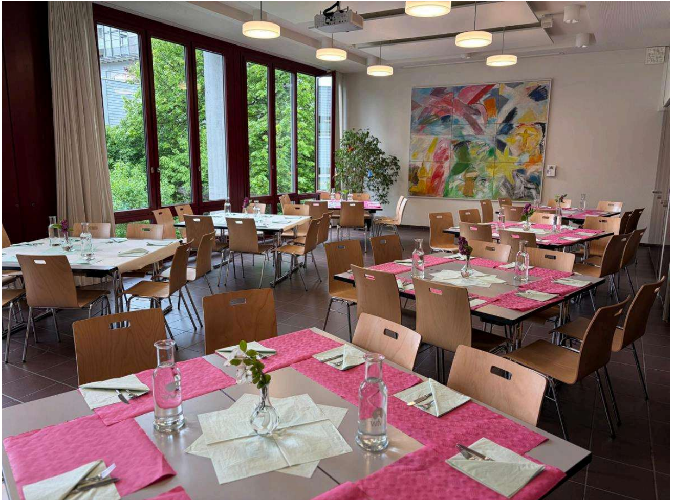
Der Esssaal im Pfarreizentrum St. Johannes.

Im Esssaal sind bereits die Tische gedeckt. Noch befindet sich fast niemand im Raum. Eine Frau und ein Mann platzieren sorgfältig die letzten Gläser auf den Tischen. Eine andere Frau steht am Fenster und telefoniert in einer Sprache, die ich weder kenne noch verstehe.