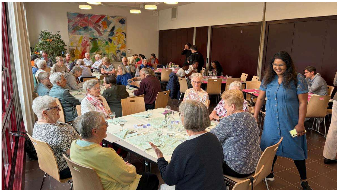
Am Mittagstisch treffen Einheimische und Geflüchtete aufeinander.

Veröffentlichung: 02.05.2026, 17:07 Uhr • Aktualisiert: 02.05.2026, 17:09 Uhr • ⌚ 8 Minuten • 💬 2